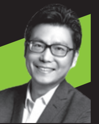
董本洪 阿里巴巴集团 首席市场官