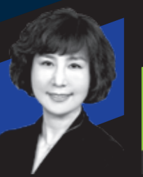
金昱冬 Visa 亚太区高级副总裁 兼市场营销主管