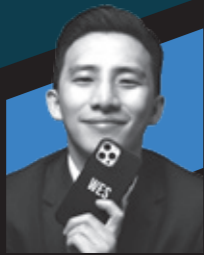
吴培燊 CASETIFY 联合创始人及行政总裁